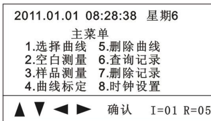
图二 液晶屏示意图